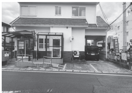
松江春日簡易郵便局外観

も、三代巡って都会から松江に戻り住み、四代目となる赤ちゃんを連れてご夫婦が「お元気で